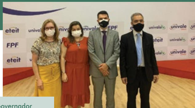
Governador Valadares e Teófilo Otoni recebem eventos para discutir estratégias de enfrentamento de óbitos maternos e infantil