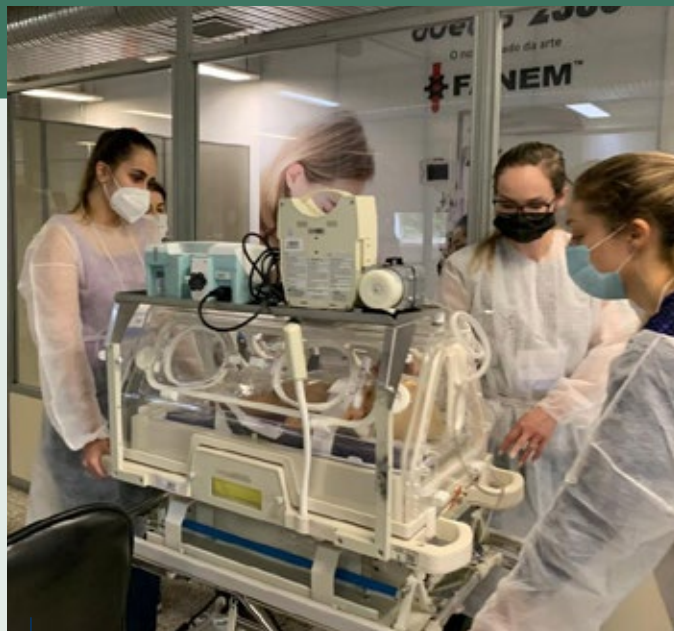
Alunos do primeiro curso de Transporte do Recém-Nascido de Alto Risco de 2021 (27/11) em treinamento na DataMed

http://sistemas.crmmg.org.br/educacao-medica