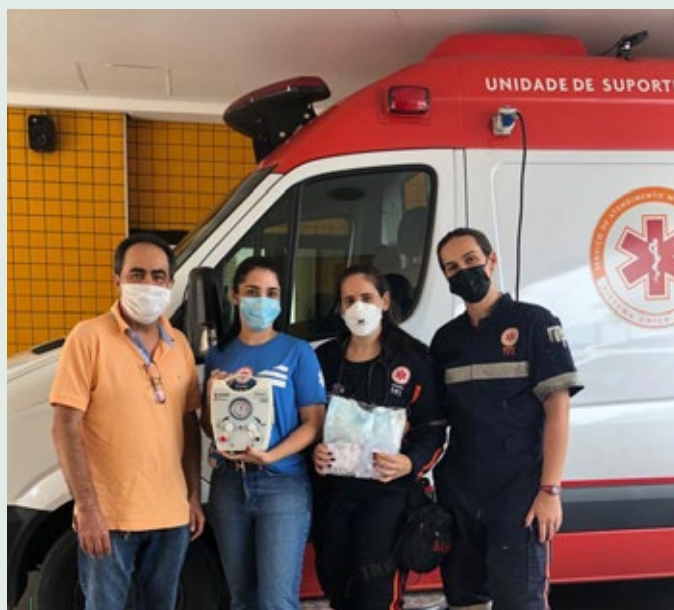
A DataMed, parceira da SMP na realização do curso de Transporte do Recém-Nascido de Alto Risco, doou para o SAMU de Belo Horizonte um babypuff (ressuscitador infantil). Essa interação foi possível graças à realização do curso

Outros cursos – Dentro do Programa de Educação Médica Continuada do CRMMG, a SMP ainda oferece os cursos de Reanimação Neonatal e do Prematuro, com intensa programação até 31 de março do ano que vem. Além disso, a SMP realiza o Curso de Suporte Avançado de Vida em Pediatria (PALS), tradicional treinamento da SMP com a equipe pioneira de Minas Gerais, e as reformulações dos cursos de Urgências em Pediatria e Trauma em Pediatria, que devem ser oferecidos em 2022.