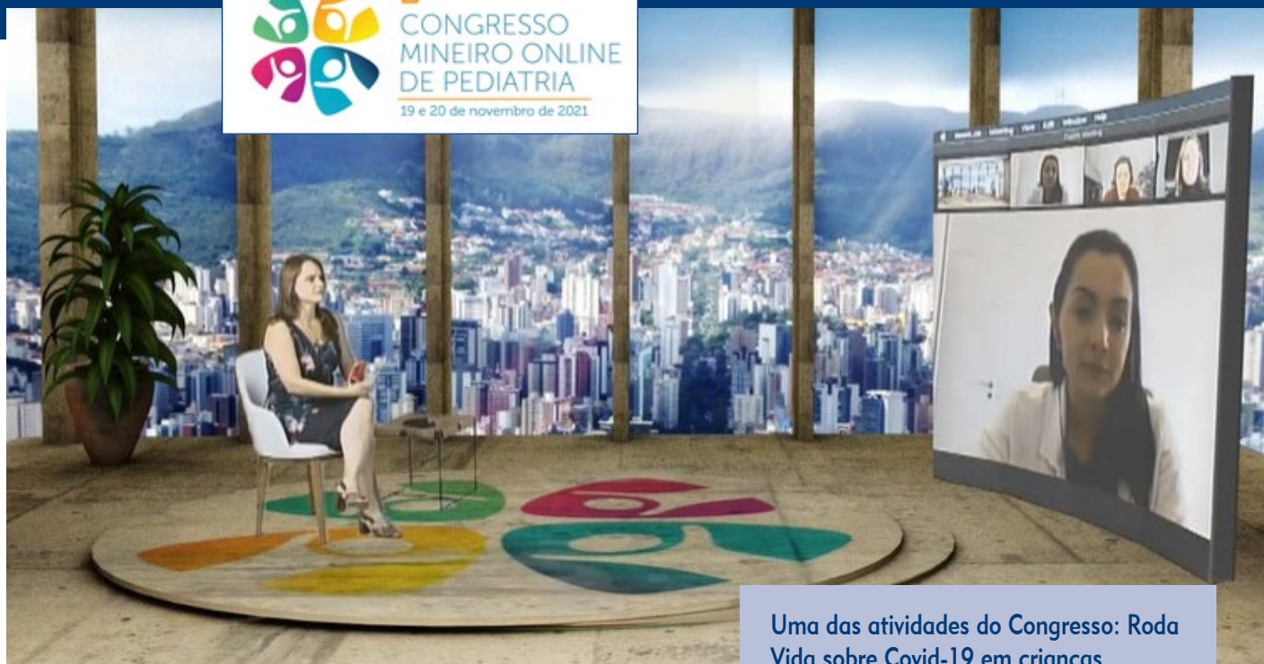
Uma das atividades do Congresso: Roda Vida sobre Covid-19 em crianças