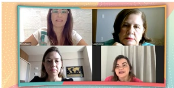
Representantes de BH e do interior de Minas falam sobre Lactente Sibilante e Asma