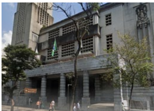
Assistência à criança e ao adolescente é tema de reunião entre Secretária de Saúde da cidade e SMP

O encontro levantou os cinco principais temas que afligem a população e os pediatras: Abordagem da Atenção Primária à Saúde (APS), Urgência e Emergência, Nível Terciário, Garantia de exames complementares de média e alta complexidade e Apoio interprofissional a crianças com necessidades especiais. O secretário se mostrou sensibilizado com os temas levantados, inclusive com a possibilidade de outras reuniões para a continuidade da discussão. Ele ainda acrescentou que os representantes da SMP ficaram satisfeitos com a abertura do diálogo, a capacidade de trabalho, o dinamismo e a boa intenção da nova secretária.