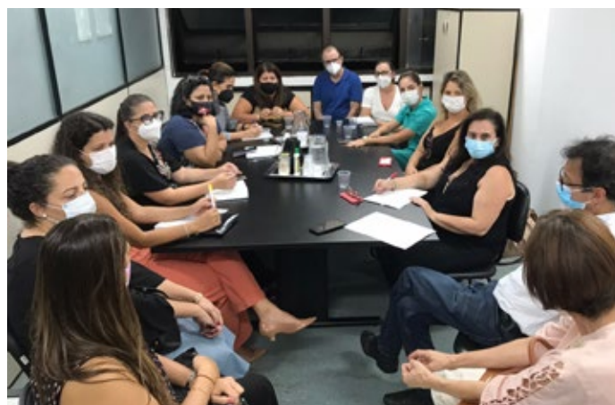
Reunião entre representantes da Regional Zona da Mata e da Secretaria de Saúde de Juiz de Fora