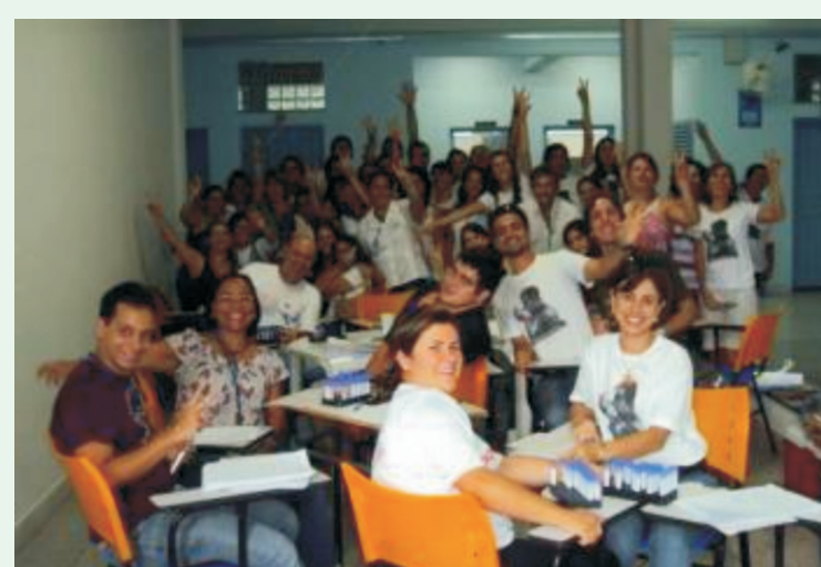
Campanha em Patos de Minas reuniu 1.700 cadastros

O Redome está conectado aos cadastros da Europa e dos Estados Unidos. Assim, o perfil genético do paciente, registrado no Registro Nacional de Receptores de Medula Óssea (Rereme) pode ser comparado com inúmeros possíveis doadores.