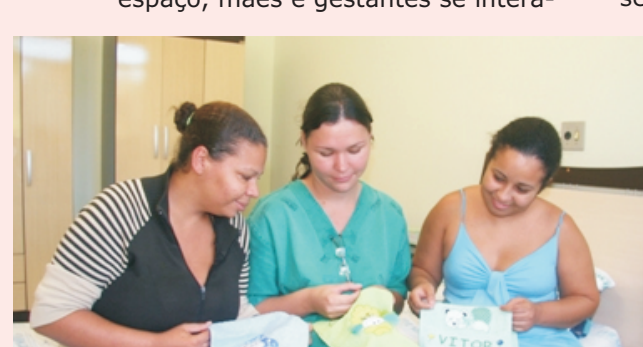
Casa da Gestante proporciona ambiente familiar

A Secretaria de Estado de Saúde (SES) pretende ampliar o projeto nas macrorregiões de Minas.