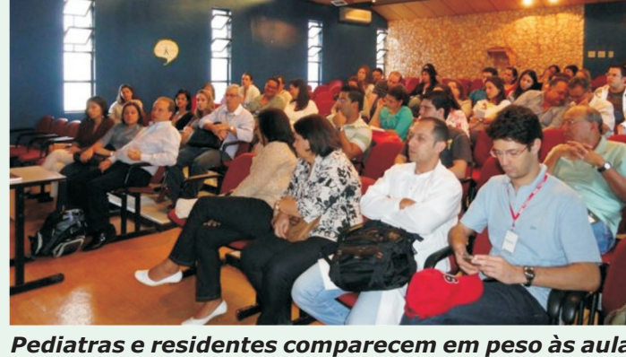
Pediatras e residentes comparecem em peso às aulas