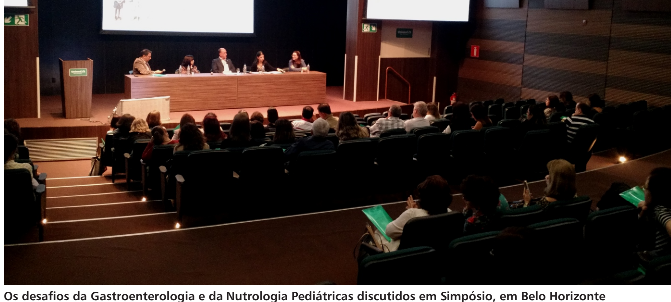
Os desafios da Gastroenterologia e da Nutrologia Pediátricas discutidos em Simpósio, em Belo Horizonte