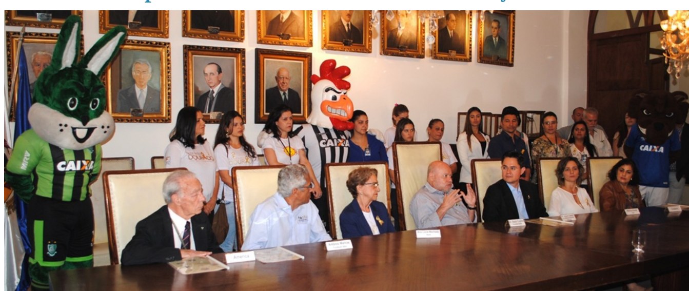
Clubes de Futebol, Casas de Apoio, hospitais e instituições juntos pelo Setembro Dourado em Belo Horizonte

Aconteceu no dia 1º de setembro o lançamento da campanha Setembro Dourado de 2017. Com apoio da Sociedade Mineira de Pediatria, o evento foi realizado na sala de reuniões da Provedoria da Santa Casa BH (SCBH) e marcou o início de uma série de ações que acontecerão nas próximas semanas, com o objetivo de conscientizar a sociedade sobre o câncer infantojuvenil.