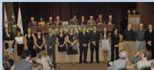
Durante a Cerimônia, foram apresentados os presidentes dos Comitês Científicos