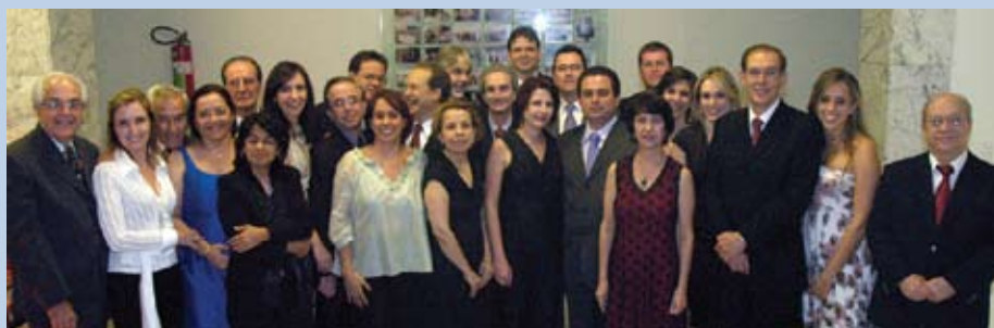
Diretoria da gestão 2009/2012